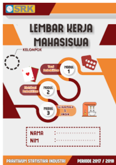
Gambar 3. Sumber belajar berbentuk LKM

Adapun keuntungan dari penggunaan LKM adalah a) memudahkan pendidik dalam melaksanakan pembelajaran, b) membuat mahasiswa menjadi lebih mandiri. LKM dapat dibuat sendiri oleh pendidik sesuai dengan kompetensi yang akan dicapai, sesuai dengan lingkungan belajar, sesuai dengan kondisi sosial peserta didik dan bersifat kontekstual.