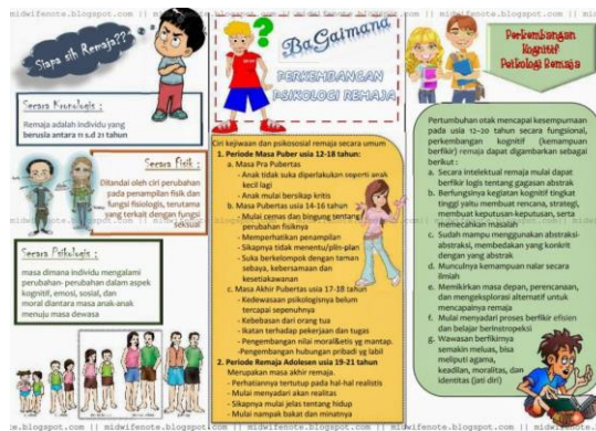
Gambar 6. Leaflet

Dalam menyusun sebuah leaflet sebagai bahan ajar, leaflet paling tidak memuat antara lain: