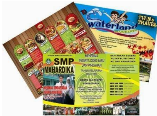
Gambar 5. Brosur

Brosur merupakan bahan informasi tertulis mengenai suatu masalah yang disusun secara sistematis yang berisi keterangan singkat tetapi lengkap (Haryanto, 2016). Brosur dapat dimanfaatkan sebagai sumber belajar selama sajian brosur diturunkan dari kompetensi dasar yang harus dikuasai oleh mahasiswa.