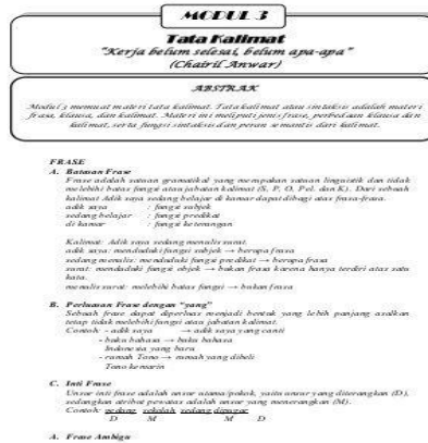
Gambar 2. Modul sebagai sumber belajar

pengalaman belajar yang terencana dan didesain untuk membantu peserta didik menguasai tujuan pembelajaran. Fungsi modul adalah sebagai sarana belajar mandiri, sehingga mahasiswa dapat belajar sesuai dengan kecepatan masing-masing (Daryanto, 2013).