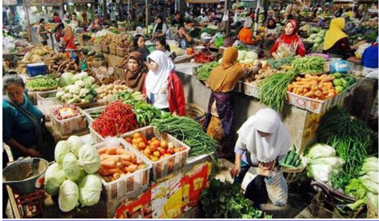
Gambar 7. Foto

Melalui media gambar ini dapat membantu gagasan-gagasan yang abstrak dalam bentuk yang realistis, sebab dapat memberikan gambaran yang kongkret tentang masalah yang digambarkan. Sebagaimana dikemukakan oleh Hastuti (1996/1997: 178) bahwa kelebihan dari media gambar adalah sebagai berikut: 1) dapat menterjemahkan ide-ide abstrak ke dalam bentuk yang lebih nyata; 2) banyak tersedia dalam buku-buku, majalah, Koran, katalog, atau kalender; 3) gambar sangat mudah dipakai karena tidak membutuhkan peralatan; 4) gambar relatif tidak mahal; dan 5) dapat digunakan untuk semua tingkat pengajaran dan bidang studi.